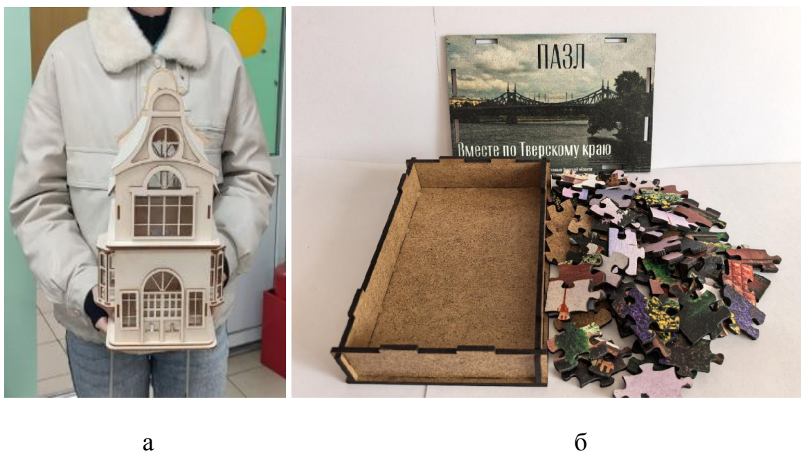
Рис. 3. Примеры ученических работ, выполненных в рамках кружка «Инженерная графика»: а – домик с подсветкой, разработанный и собранный студенткой; б – пазл для выпускной квалификационной работы учащейся колледжа

колледжа создала изделие, которое позволило ей защитить выпускную работу (стартап) (рис. 3б).