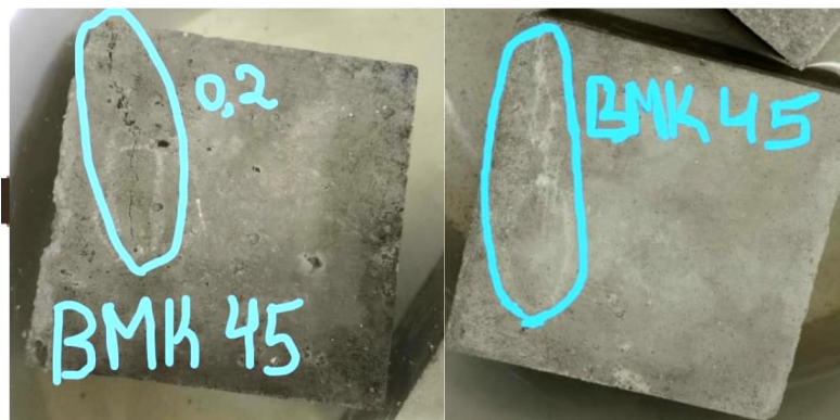
Рис. 2. Процесс восстановления трещины с добавкой ВМК

Механизм гидратации цемента с молотым доменным шлаком – это синергетический процесс, в котором портландцементный клинкер выполняет роль каталитического активатора, создавая щелочные условия для раскрытия вяжущего потенциала шлака. Под действием щелочи стекловидная структура шлака разрушается. В результате гидратации смешанного цемента образуются гидросиликаты кальция (C-S-H) и гидрогранаты ( C_3AS_xH_{6-2x} ), происходит снижение количества Ca(OH)_2 за счет пуццолановых реакций. C-S-H фаза, образующаяся из шлака, часто имеет более низкое соотношение Ca/Si, чем C-S-H из чистого клинкера. Такая фаза имеет более мелкопористую структуру, которая уплотняет матрицу цементного камня и обладает повышенной стойкостью к химическим агрессиям.