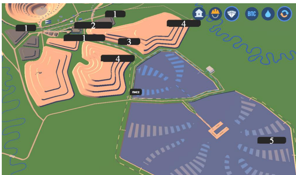
Рис. 1. Производственная площадка: 1 – склад руды; 2 – обогатительная фабрика; 3 – трубопровод; 4 – отвал пустых пород; 5 – хвостохранилище [20]

На рис. 1 показана карта производственного процесса, демонстрирующая соотношение складированных отходов к добытой руде. Так, на конец 2020 года в пруд-отстойник заскладировано около 8,23 млн т хвостов, в хвостохранилища отправлено 24,6 млн т [20].