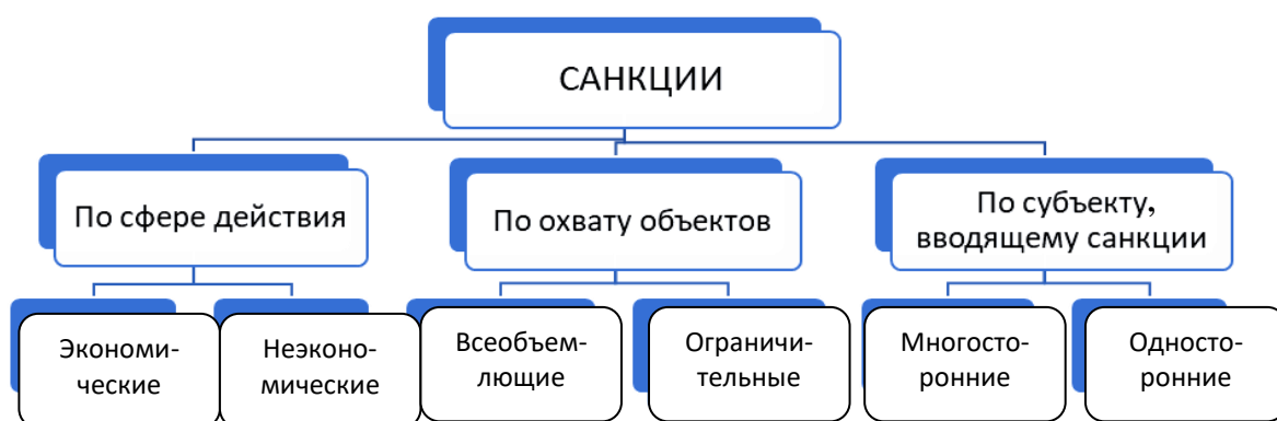
Рис. 1. Классификация санкций (составлено автором по источникам [2, 4])

Санкции можно классифицировать по нескольким критериям (рис. 1).