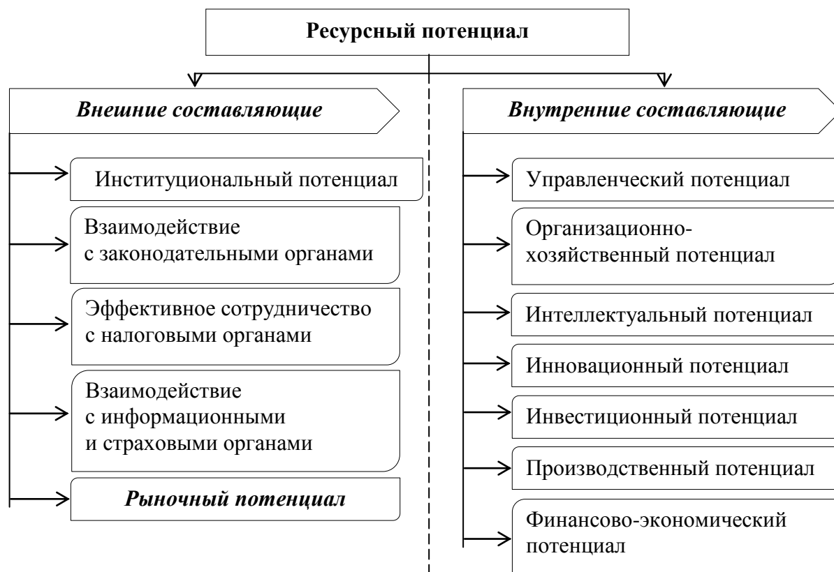
Рис. 2. Структура ресурсного потенциала с учетом внешних и внутренних составляющих

Проблема неэффективного использования ресурсов становится все более важной как для отечественных, так и для зарубежных