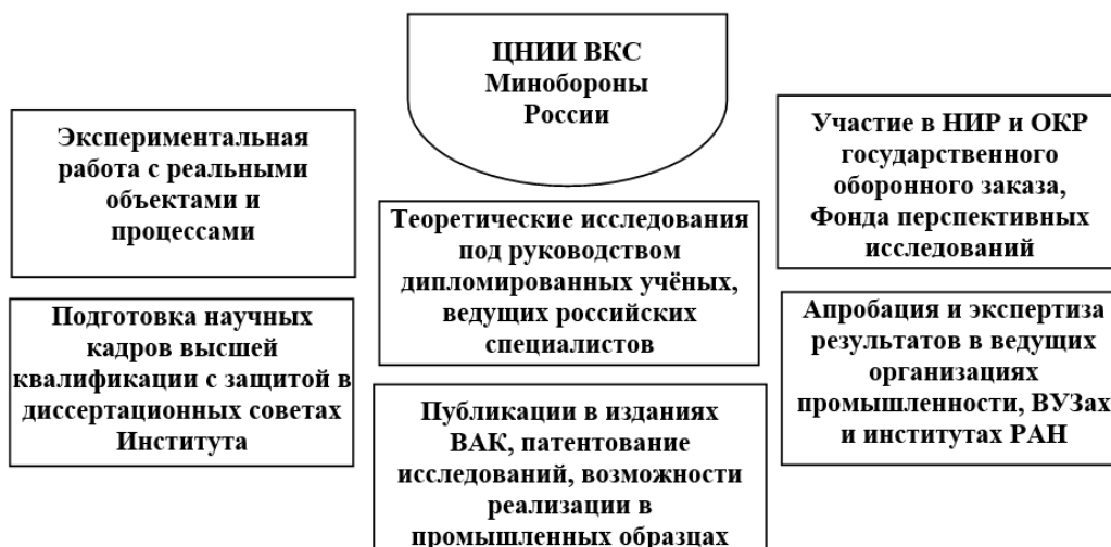
Рис.2. Возможности ЦНИИ ВКС Минобороны России по организации системных научных исследований для молодых ученых специалистов, выпускников высших учебных заведений

Следует отметить, что многие из представленных выше возможностей активно реализуются в образовательных учреждениях Твери, включая работу по профессиональной ориентации в физико-математической школе № 17 и Тверском суворовском военном училище. Наибольшие результаты достигнуты в настоящее время в сотрудничестве с ТвГТУ и сосредоточены на следующих направлениях: