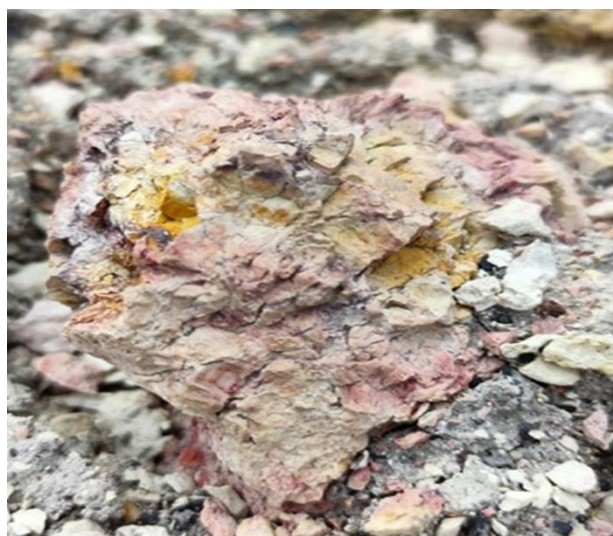
Рис. 2. Породные отходы Нелидовского техногенного месторождения