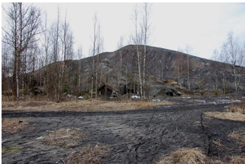
Рис. 1. Техногенное месторождение Нелидовских шахт

На шахтах Нелидовского месторождения бурого угля для транспортирования породы на отвал преимущественно использовались канатная откатка скипами или вагонетками по рельсовым путям, в результате чего образовались отвалы конической формы (рис. 1). По условиям хранения отходы относятся к категории «лежалые», т.е. они хранились в течение определенного времени и подверглись процессам вторичного минералообразования и изменению структуры массива [1, 16]. Техногенные массивы расположены близко к производству (шахте), для каждой шахты был создан свой отвал. Формирование исследуемого техногенного массива проводилось по технологии слоистого строения отвала. В разные периоды эксплуатации отсыпались неоднородные по свойствам (крупности кусков, их составу, влажности и т.д.) порции техногенного сырья. Слои с более крупными кусками породы чередуются со слоями мелочи (рис. 2).