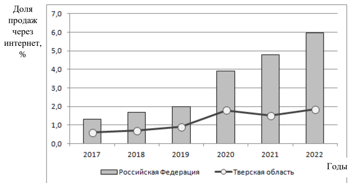
Рис. 3. Доля продаж через интернет в общем объеме оборота розничной торговли (составлено авторами по данным [5])

В условиях цифровой экономики торговля является наиболее перспективным и предпочтительным видом деятельности для МСБ. Эта та сфера, где цифровые технологии успешно внедряются и применяются как продавцами, так и покупателями. Речь идет в первую очередь об интернет-торговле, которая в настоящее время активно вытесняет традиционную. При этом темпы развития интернет-торговли в Тверской области значительно ниже общероссийских (рис. 3). Данный факт показывает имеющиеся возможности развития МСБ Тверской области в этом направлении.