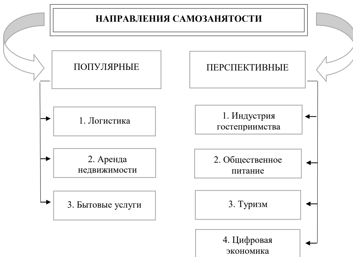
Рис. 2. Направления деятельности самозанятых граждан в Крыму (составлено авторами по данным [6])

В целом в индустрии гостеприимства в Крыму самозанятым предоставляется достаточно много возможностей для реализации своих навыков и ресурсов в интересующем их виде деятельности, т. е. такие граждане могут быть задействованы в общественном производстве, получать легальный доход и, следовательно, повышать собственное благосостояние.