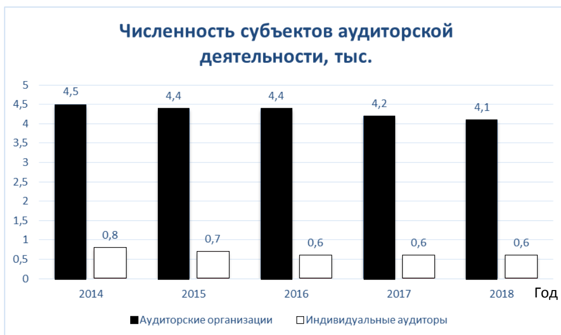
Динамика численности субъектов аудиторской деятельности в Российской Федерации

Исходя из анализа данных, опубликованных Минфином России [2], количество аудиторских организаций и индивидуальных аудиторов, имеющих право на осуществление деятельности, за период 2014–2018 гг. сократилось на 17,5 % (с 5 700 до 4 700), включая сокращение как аудиторских организаций на 8,9 % (на 400 тысяч), так и индивидуальных аудиторов на 25 % (200 тысяч). Таким образом, общая численность аудиторов за данный период уменьшилась на 13,4 % (3 000 специалистов).